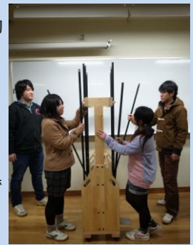
(図2) 図2 両側掛け