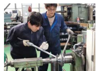
図6. 加工体験の様子